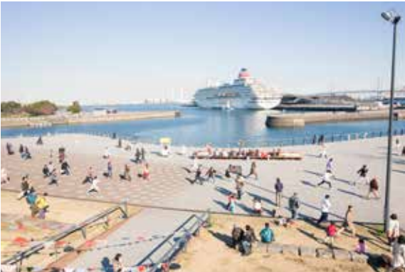
象の鼻パークの青空の下、みんなで身体を動かす！