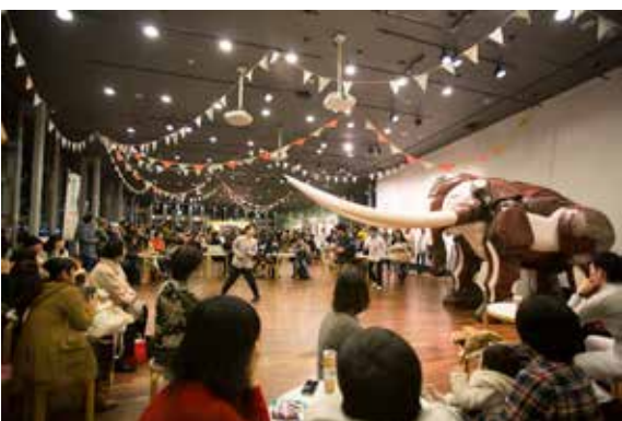
窓から遠い場所に移され、夜景が見えない象のペリー。その想いを叶えてやろうと居合わせた人たちが手伝って……。象は夜景が観たいぞうより。