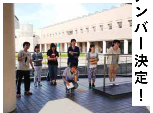
オーディションの様子

メンバーは、2月の上演に向けて、これから約半年間にわたり劇作を重ねていきます。その過程で、劇団員たちもそれぞれ三重を訪れ、ワークショップを行ったり、俳優や制作といった自身の役割に