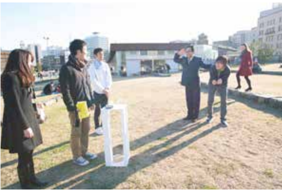
スイッチは象の鼻テラスでも大人気でした。