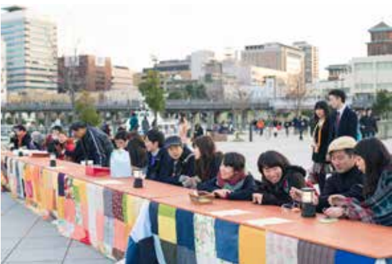
知らない人同士が隣り合って足を温め合う「海の見えるKOTATSU」。