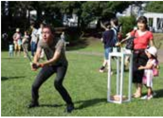
「多摩1キロフェススイッチ」